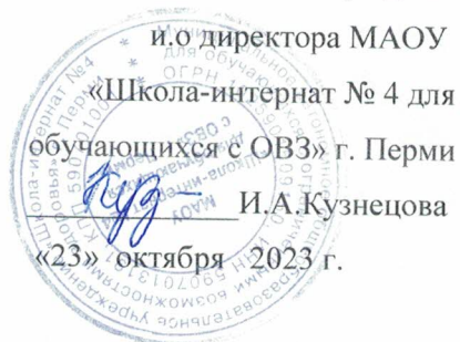
ГРАФИК ПРОВЕДЕНИЯ ШКОЛЬНЫХ МЕТОДИЧЕСКИХ ОБЪЕДИНЕНИЙ