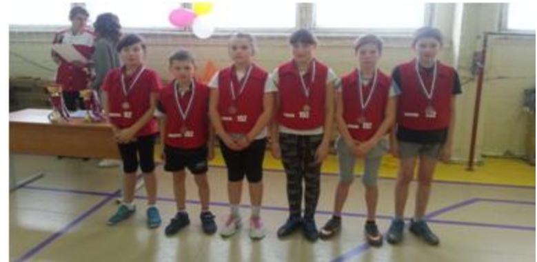
Подвижные игры 4 место