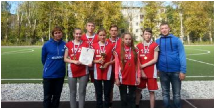
Легкая атлетика 1 место