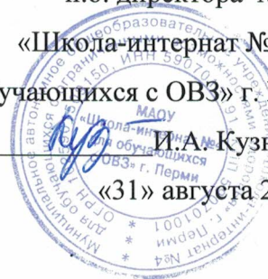
График проведения методических недель на 2023-2024 учебный год